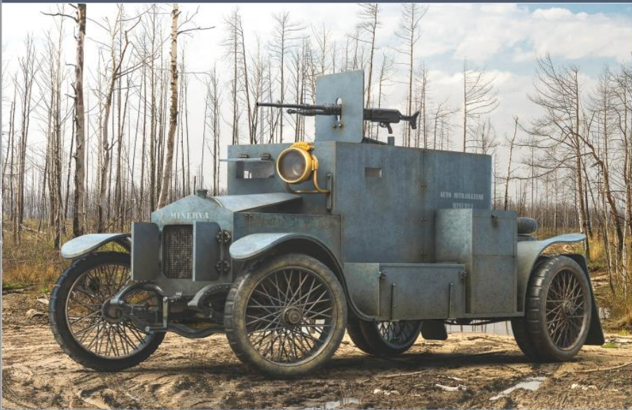
Minerva armoured car BELGIAN WWI ARMOUR